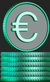
Partner-Rabatt regulär 20 %