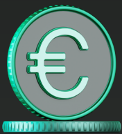
Partnerstatus Registered Partner

Bis zum 01.09.2026 erhalten Sie mindestens 60 % Rabatt auf unsere beiden fortschrittlichen Lösungen Kaspersky Next EDR Foundations und Next EDR Optimum im Paket mit unserem Health Check Service . Jeder Deal bringt Sie näher an den Gold-Partnerstatus und damit dauerhaft höheren Margen, dediziertem Support und professionellen Vertriebstools.