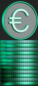
Partner-Rabatt Promo 60 %